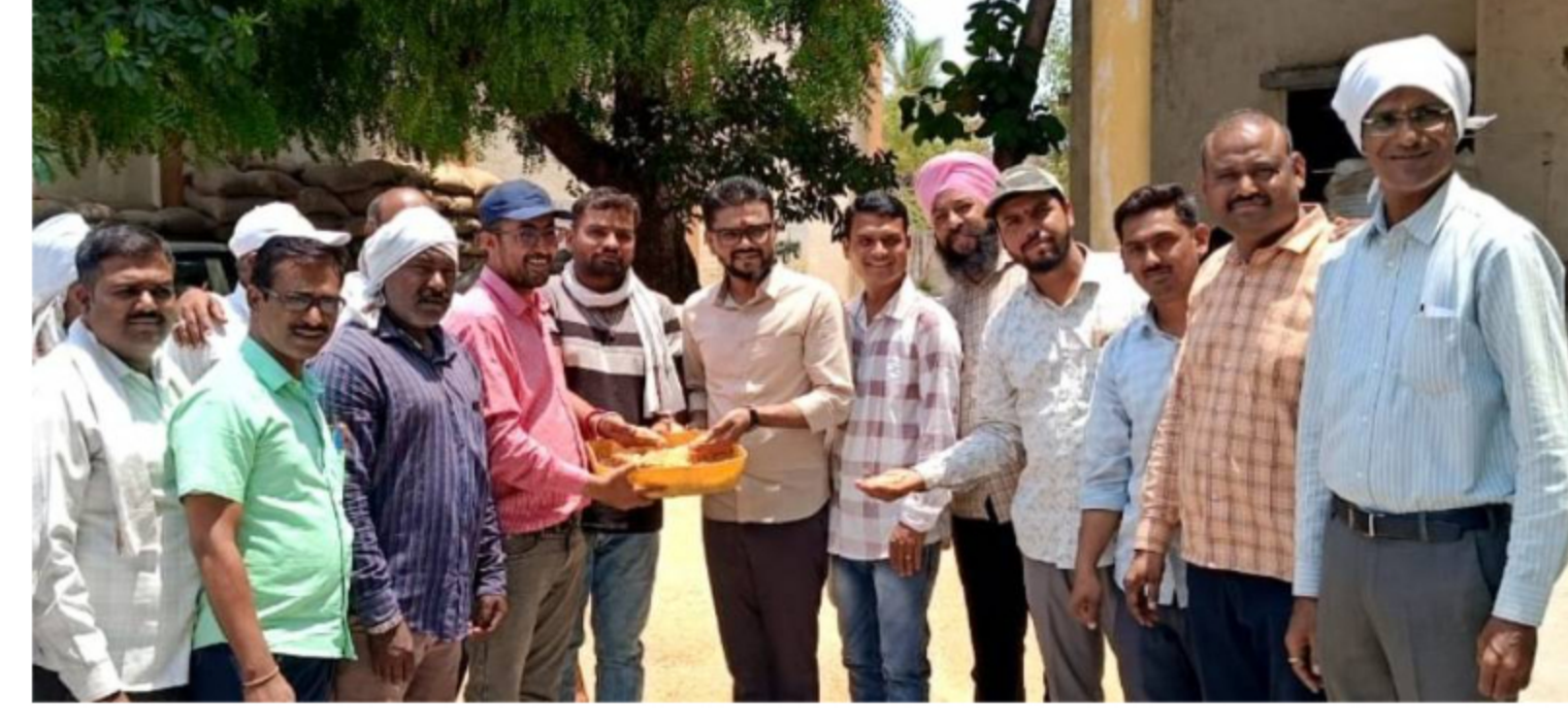
लिलाव वेळी मालाची पाहणी करताना व्यापारी व शेतकरी.